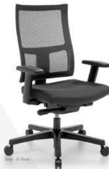
Step - 01 Rede