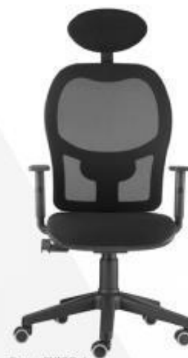
Funny - DUAD Rede