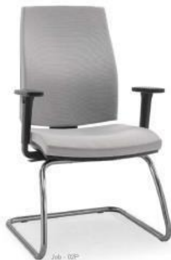
Job - 02P