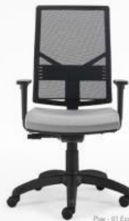
Play - G1 Eco