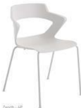
Zenith - GP