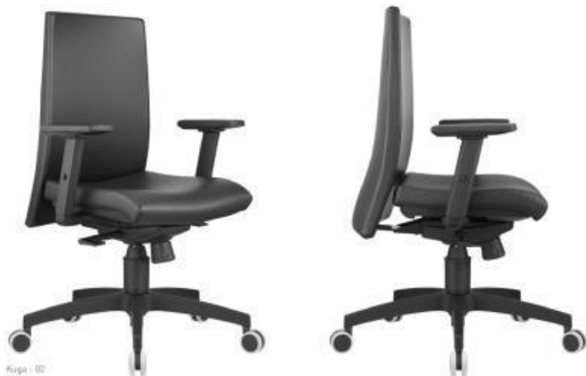
Kuga - 02