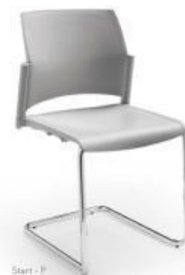
Start - P