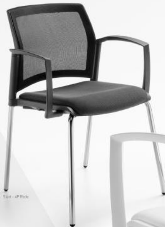
Start - 4P Rede