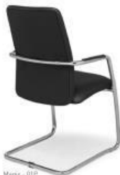
Magix - 01P