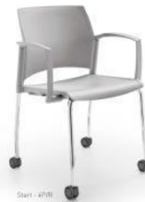
Start - 4Pff