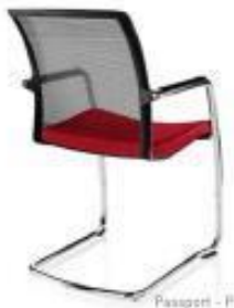
Passport - P