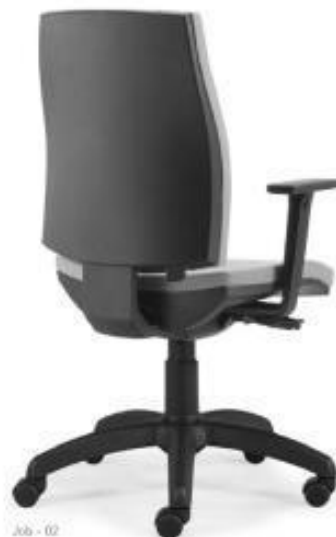
Job - 02