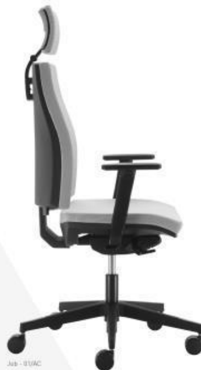
Job - 01/AC