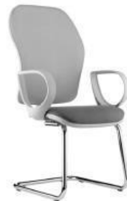
Funny - B1P G2