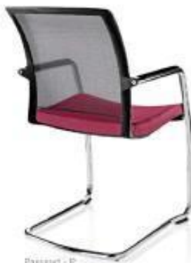
Passport - P

Costa: Bacia. Em rede. Assento: Em espuma de alta densidade. Estrutura: Rodada, patim e 4 pés. Braços: Fixos integrados na estrutura. Mecanismo: Multiblock.