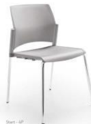
Start - 4P