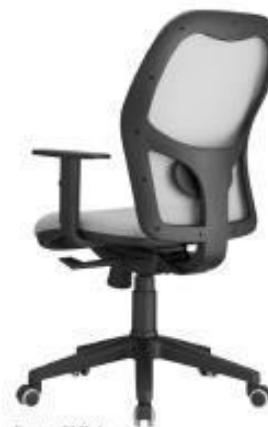
Funny - B1 Rede