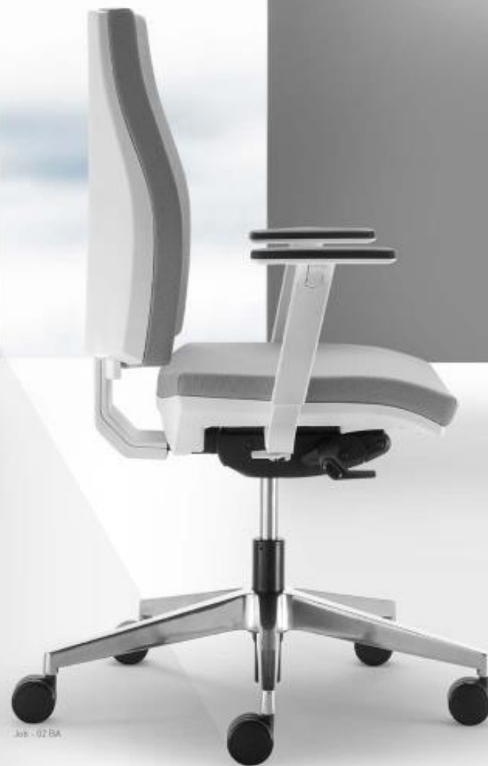
Job - 02 BA