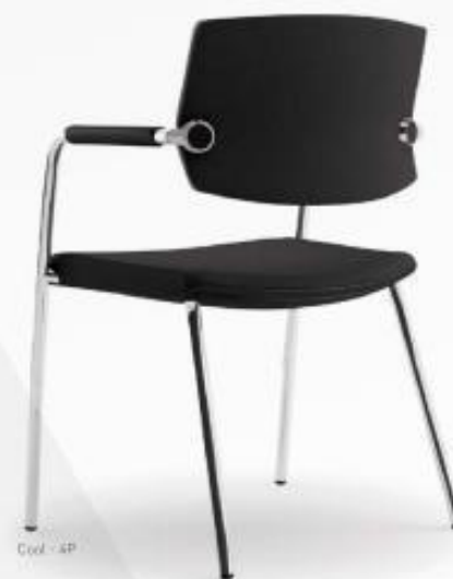
Cool - AP