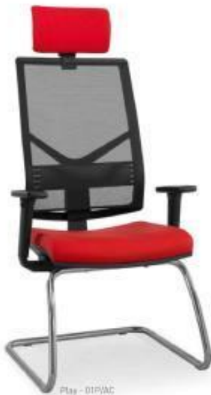
Play - DIPAC