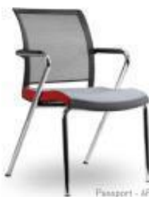
Passport - AP

Costa: Alta. Em rede. Com regulação em altura. Assento: Em espuma de alta densidade. Mecanismo: Sincron. Assento regulável em profundidade (opcional). Base: Em poliamida ou alumínio. Plásticos: Disponíveis em preto e em branco. Bracos: Fixos ou reguláveis (opcional). Outras versões: Cadeira com estrutura patim.