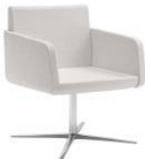
Sofa - Indiv. 4R