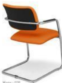
Magix - 02P