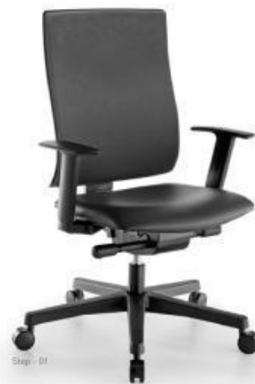
Step - 01