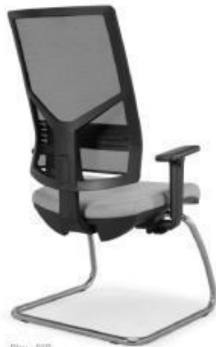
Play - DIP