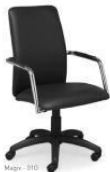
Magix - 010