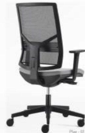
Play - G1