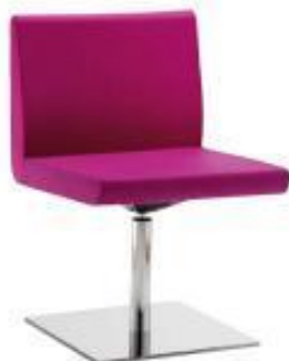
Sofa - Indiv. BQ