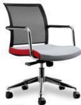
Passport - B

A chair with a finely designed dynamic profile and contemporary esthetics. Particularly style and excellent lumbar support with its back mesh.