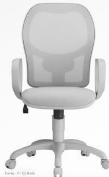
Funny - 01 CZ Rede