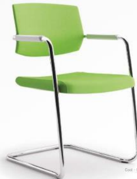
Cool - P

Costa: Baixa. Revestida. Assento: Em espuma de alta densidade. Estrutura: Póliam e 6 pés. Bracos: Fios integrados na estrutura.