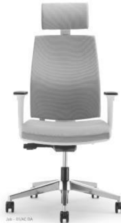
Job - 01/AC BA