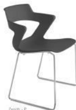
Zenith - P