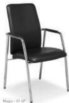
Magix - 01 4P