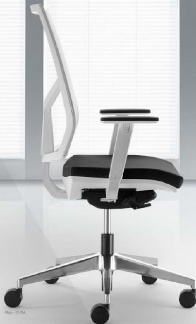
Play - 01 BA