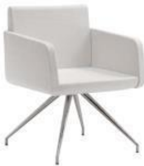
Sofa - Indiv.

Costa/Assento/Braços: Revestidos. Em espuma injetada.