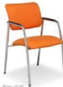
Magix - 02 4P