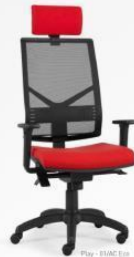
Play - E1AC Eco