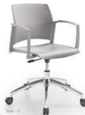
Start - O