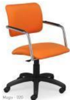
Magix - 020