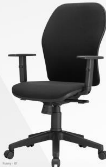
Funny - 01