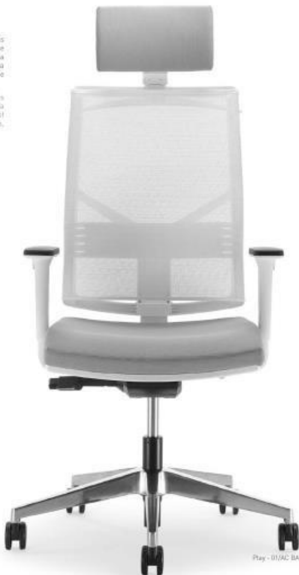
Play - 01/AC BA