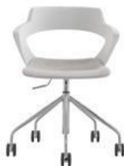
Zenith - G