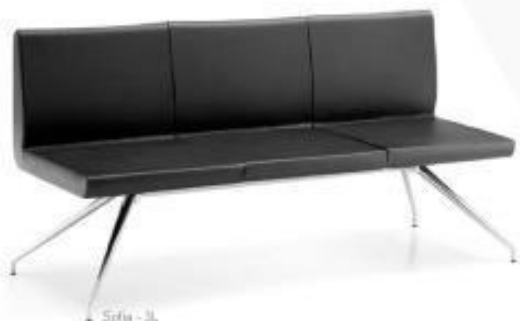
Sofa - 3L

The simple lines and elegant design make it fit in all of the waiting areas where a sofa is required.